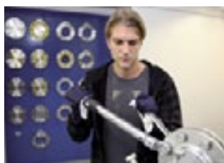
Des blocages créés artificiellement attestent de l'influence négative sur l'étanchéité

Franz Gysi AG démontre de manière exemplaire comment une entreprise technico-commerciale peut aborder l'avenir avec des produits exigeants. Une solide équipe d'ingénieurs et de constructeurs développent ensemble, avec les clients, des solutions sur mesure et économiques. Dans tous les domaines de compétence, la formation revêt une grande importance. A cet effet, Franz Gysi AG a aménagé des laboratoires de formation complets. Dans un « amas de tuyaux » déroutant pour le non-initié, les processus et les erreurs de processus sont rendus visibles. Par exemple la charge d'un système de production de vapeur fermé par la condensation non évacuée. Grâce à des tuyaux en verre et des soupapes et pièces de raccordement « découpées », les phénomènes sont visualisés et expliqués de manière efficace et pratique.