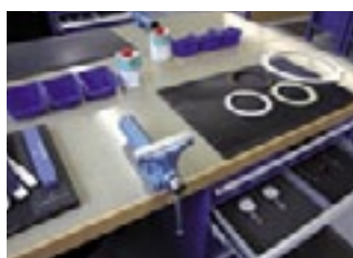
Vue d'une place de formation : avec les outils de Brüttsch/Rüeggger Tools, évidemment !