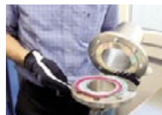
Le papier Fuji placé à l'intérieur des joints en dit long sur la qualité du vissage