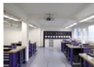
L'institut de montage est aménagé : photo d'ensemble du local de formation à Suhr