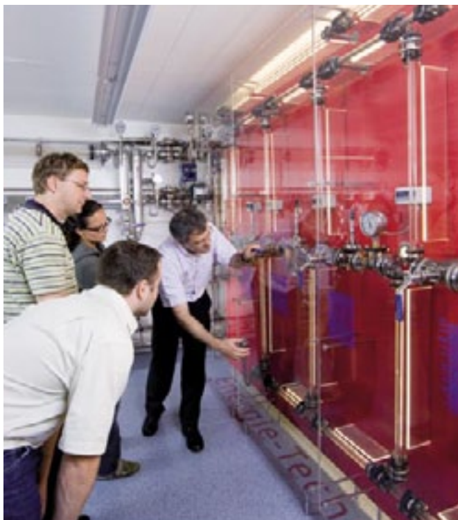
Le système de tuyauterie en verre : les participants peuvent découvrir l'intérieur d'un système

Normbook, édition 3 Professional Collection 2010 Construction de moules et découpage Référence 08.02